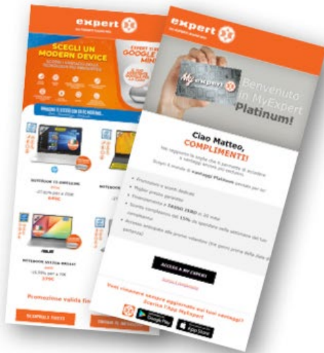
CAMPAGNES EMAIL ET TRANSACTIONNELS